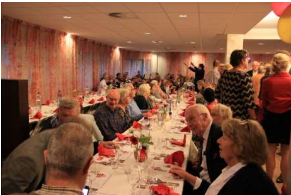
Opening Resto VanHarte Rijswijk

Naast dat vrijwilligers uit de omgeving van het Resto zich inzetten voor hun buurt, hebben ook medewerkers van het Stanislas college, leden van de Rotary Club en medewerkers van Shell zich ingezet als vrijwilliger.